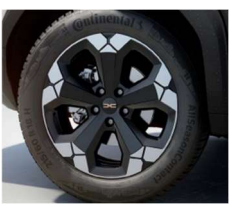
18" ζάντες αλουμινίου TAGASAN semi diamond-cut, ελαστικά 215/60 R18