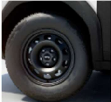
16" τροχοί, ελαστικά 215/70 R16