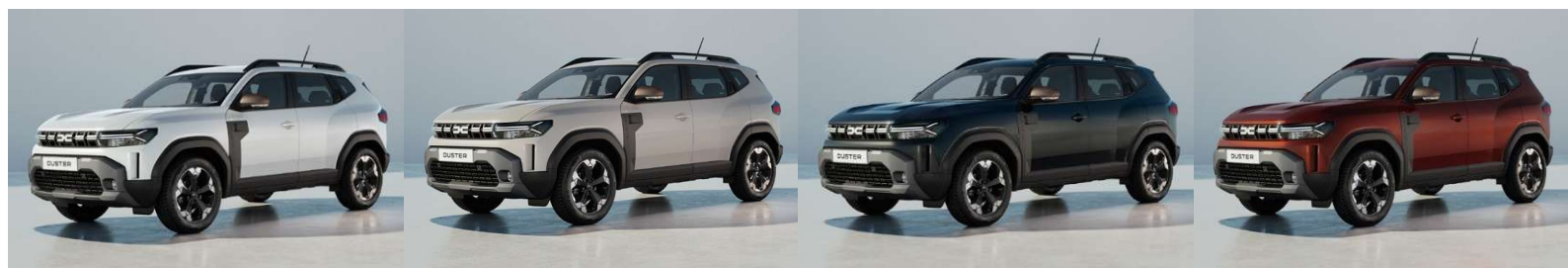
Λευκό Glacier (1)