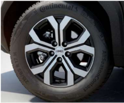
17" ζάντες αλουμινίου TORGAN diamond-cut, ελαστικά 215/65 R17