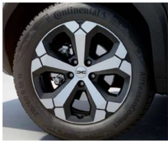
18" ζάντες αλουμινίου TAGASAN diamond-cut, ελαστικά 215/60 R18