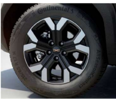
17" ζάντες αλουμινίου TORGAN semi diamond-cut, ελαστικά 215/65 R17