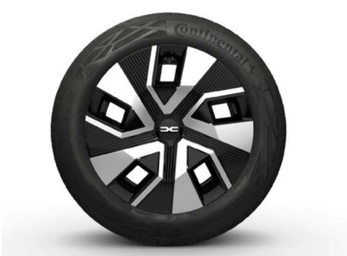
16" ΤΡΟΧΟΙ FLEXWHEEL ATARA