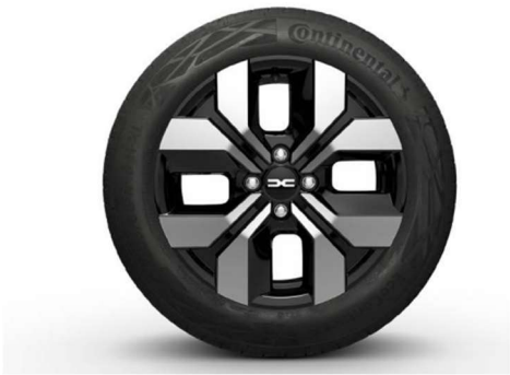
16" ΖΑΝΤΕΣ ΑΛΟΥΜΙΝΙΟΥ RANDIA (προαιρετικός εξοπλισμός)