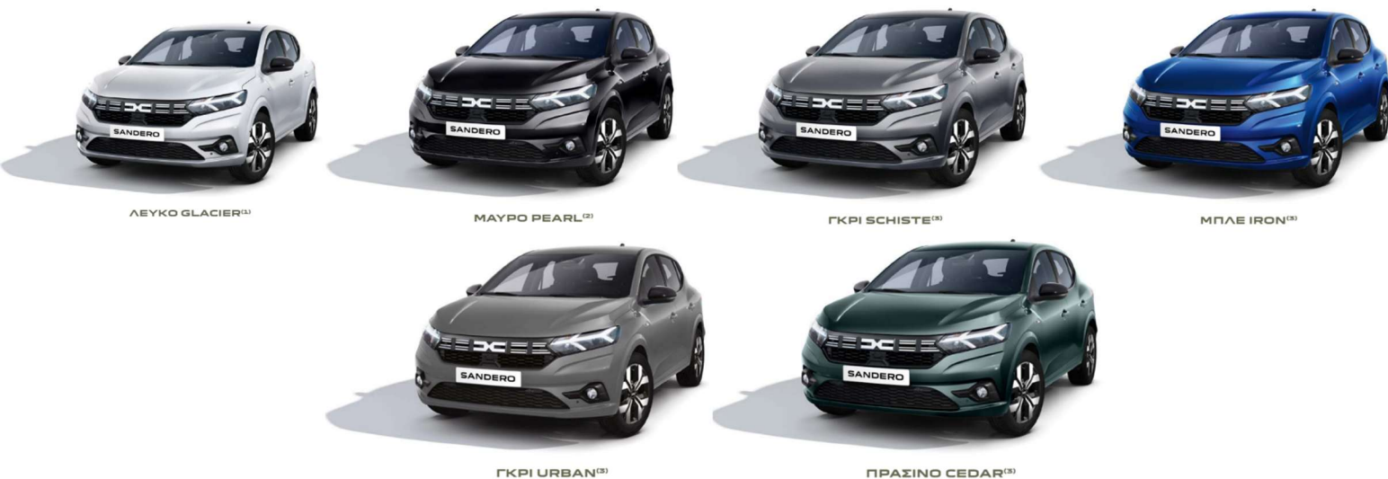
ΛΕΥΚΟ GLACIER (1)