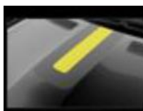
Διακοσμητικό αυτοκόλλητο καπό & οροφής fl4sh yellow