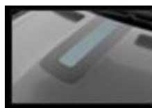
Διακοσμητικό αυτοκόλλητο καπό & οροφής fl4sh blue