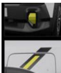
Διακοσμητικά αυτοκόλλητα προφυλακτήρων & εμπρός φτερών fl4sh yellow