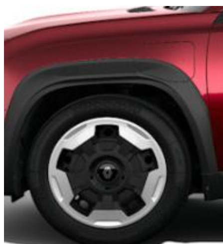
Τροχοί 18" "jogging" με δίχρωμο κάλυμμα & ελαστικά 195/60 R18