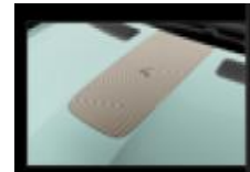
Διακοσμητικό αυτοκόλλητο καπό & οροφής numbeR4 cooper