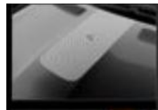
Διακοσμητικό αυτοκόλλητο καπό & οροφής numbeR4 silver